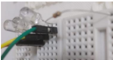
Figura 5: agora conectamos um fio em cada um dos LEDs. O professor escolheu usar os fios nas cores correspondentes às cores do LED. Se quiser ver este material na sua versão colorida, leia o QR-code abaixo.