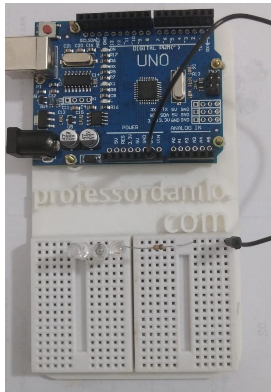
Figura 3: No GND o professor conectou três LEDs, nas cores verde, amarela e azul, olhando da direita para a esquerda. Lembre-se que o LED é polarizado e a perna mais curta deve ser conectada ao GND. O professor colocou, portanto, todos os LEDs com a perna menor do outro lado do resistor.