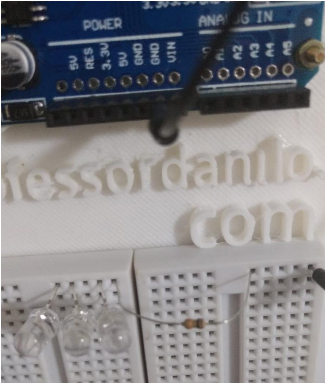
Figura 4: Veja detalhe da conexão dos resistores com o resistor.