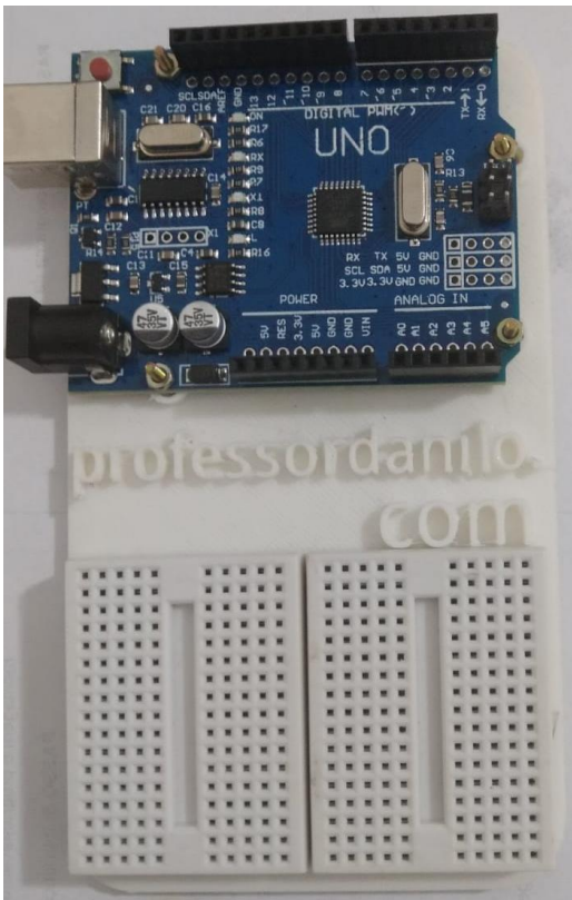
Figura 1: observe nesta figura o Arduino UNO parafusado na sua base com as duas matrizes de contato ligadas a ele.

Para isso, você vai utilizar um resistor de 220 Ohm, ou algum próximo: o professor irá te informar qual o disponível. Siga os passos das imagens a seguir.