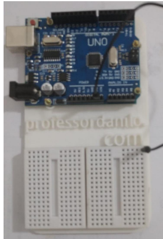
Figura 2: Note o cabo preto conectando uma linha da matriz de contato com o GND